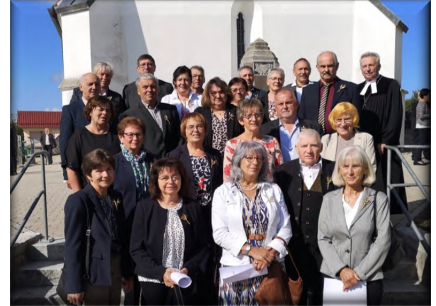
Goldene Konfirmation in Unterringingen