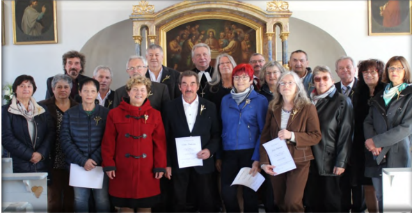
Goldene Konfirmation in Aufhausen

Zu den goldenen Konfirmationen in Aufhausen (22.10.2023), Forheim (15.10.2023) und Unterringingen (24.09.2023) waren die Jahrgänge 1968 bis 1973 eingeladen um mit Dekan Wolfemann zu feiern.