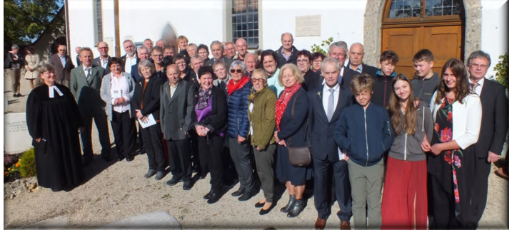
Von damals 67 sind leider acht bereits verstorben - 36 feierten mit!

(vorne rechts: Die zwei jungen Damen wurden 2023 konfirmiert, sie überreichten zusammen mit einem Konfirmanden 2024 den Jubilarrinnen und Jubilaren charmant die Urkunden)