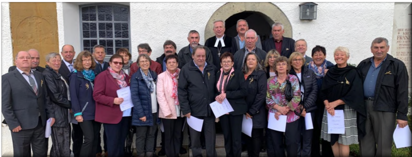
Goldene Konfirmation in Forheim